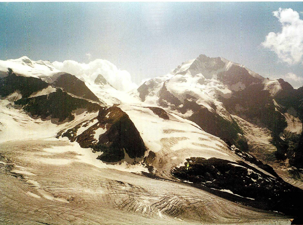
Piz Bernina und Bellavista